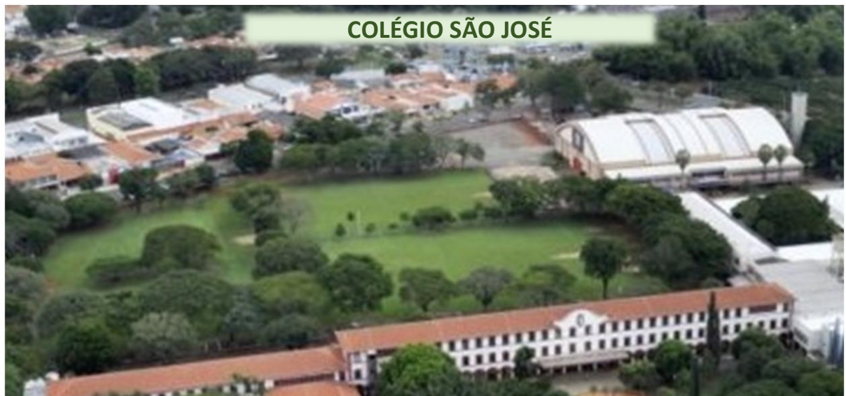
COLÉGIO SÃO JOSÉ